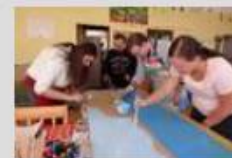
názov 021.jpg popis Maľovanie mora, pláže a oblohy