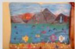
názov 001.jpg popis Podmorský svet návrh