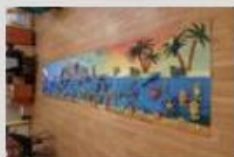
názov 034.jpg popis Naš vytvor v celku