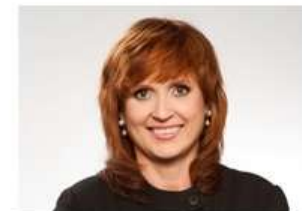
starostka mestskej časti Bratislava - Staré Mesto Tatiana Rosová »